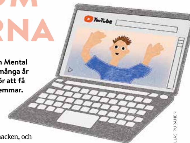
ILLUSTRATION: LINNEA TELJAS-PURANEN

Riksförbundet för Social och Mental Hälsa är till för alla åldrar. I många år har det funnits en längtan för att få fler unga, engagerade medlemmar. Revansch kikar närmare på historien och spanar även framåt.