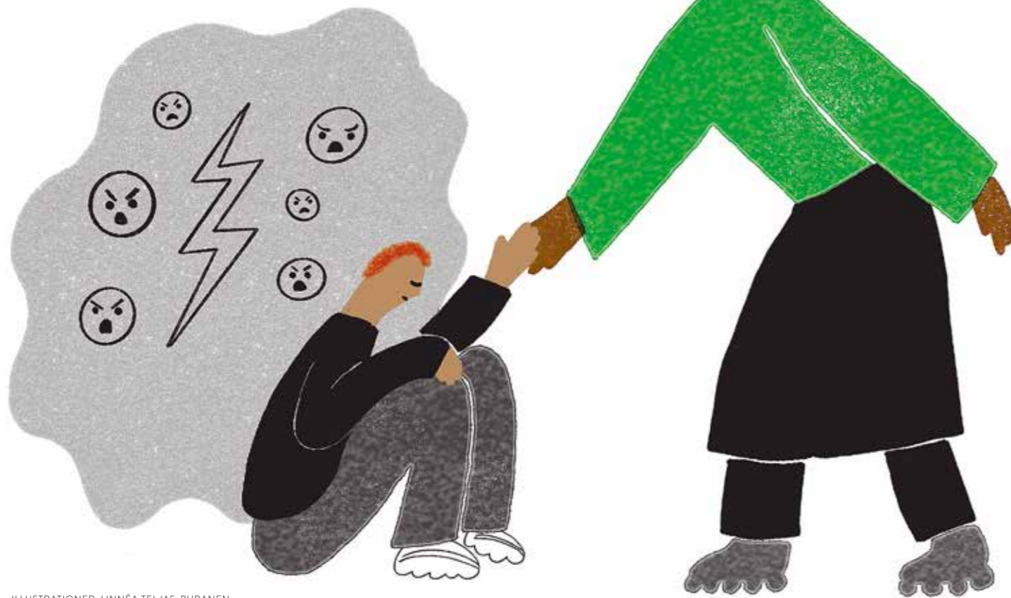
ILLUSTRATIONER: LINNÉA TELJAS-PURANEN

PO Unga ska stötta barn med psykisk ohälsa.