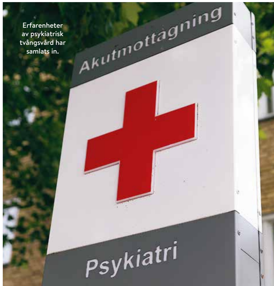
Erfarenheter av psykiatrisk tvångsvård har samlats in.

De positiva omdömen som patienter ger handlar bland annat om att gå från