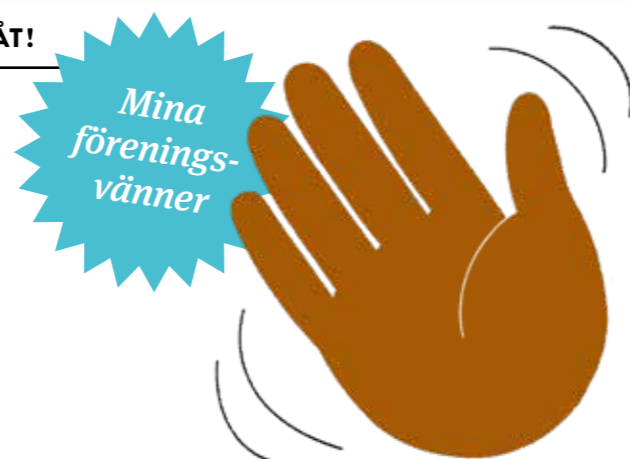
ILLUSTRATION: LINNEA TELJAS-PURANEN

linneadunek@yahoo.se telefon 073-876 43 21