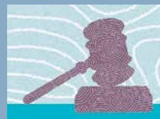
ILLUSTRATION: LINNEA TELJÄS-PURANEN