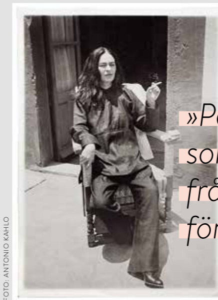
Utställningen »Frida Kahlo – Her photos« visas på Kulturhuset i Stockholm fram till den 1 oktober 2023.

Personer födda från 2010 och till och med i år kallas generation Alpha. Eftersom det fötts många bebisar under dessa år är också den yngsta generationen den största i Sverige – nära 1,5 miljoner människor vilket motsvarar 14 procent av befolkningen.